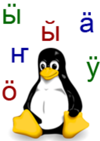
Коллаж: Васли Николаев

Появились многослойные шрифты, где место одновременно нашлось многим знакам – наряду с латинскими алфавитом они содержали кириллицу и специфические буквы всевозможных языков, в том числе и марийские. Таблица символов Юникод постоянно пополняется.